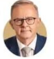
एंथनी एल्बानीज ऑस्ट्रेलिया

समित का मुद्दा: इंडो-पेसिफिक सिक्योरिटी, क्लाइमेट चेंज हेल्थ सिक्योरिटी, टेक्नोलॉजी एंड साइबर सिक्योरिटी