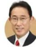
फूमियो किशिदा जापान