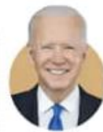
जो बाइडेन अमेरिका