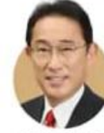
फूमियो किशिदा जापान