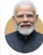
नरेंद्र मोदी भारत