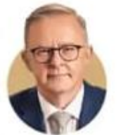
एंथनी एल्बानीज ऑस्ट्रेलिया

समित का मुद्दा: इंडो-पेसिफिक सिक्योरिटी एंड डेवलपमेंट क्वांटम कंप्यूटिंग, सेमीकंडक्टर, बायो टेक्नोलॉजी