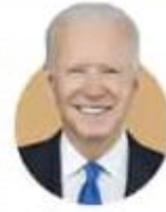
जो बाइडेन अमेरिका